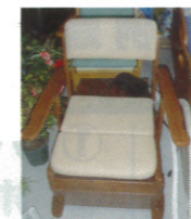
加賀 敦 様 ポータブルトイレ

当協議会では、介護機器の寄付をお願いしております。(使用できる状態のものに限ります。)寄贈していただける方は、当協議会までご連絡ください。