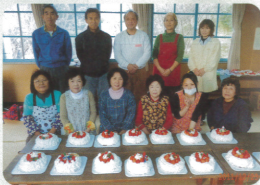
初の試みでしたが、とても素敵なケーキができました

今年は、5区、13区の2つの地区でケーキ作りを通した世代間交流が行われました。5区では、子どもたちが毎年楽しみにしており、思い思いの作品を地域の婦人会や住民の方々と楽しんで作成されました。13区では、初の試みとして、地域の方々によるケーキ作りが行われました。出来上がったケーキは地域の高齢者がおられるお宅にも配られました。