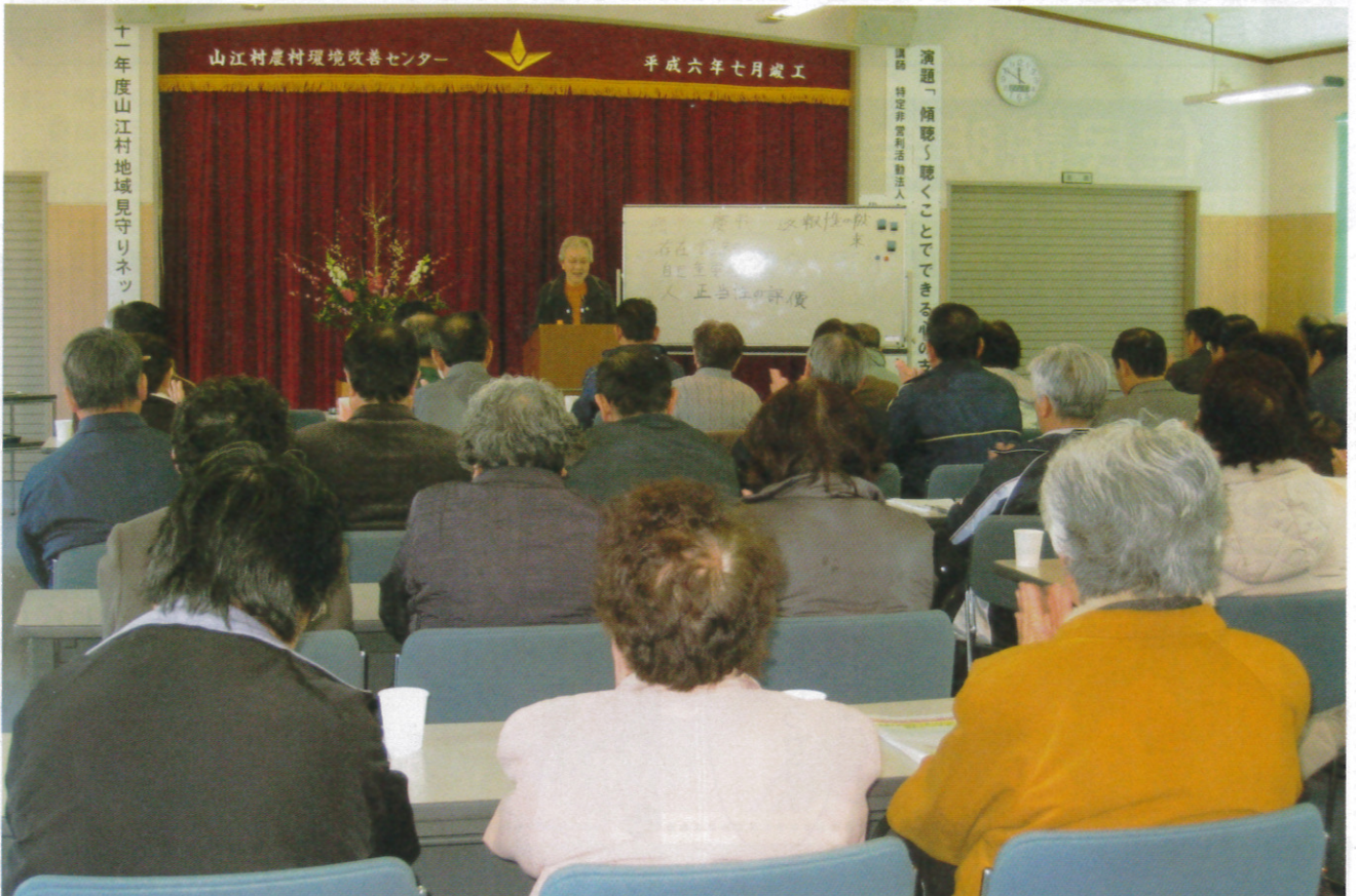
「傾聴に関する講演会」 ～講師の先生の話しに耳を傾ける参加者～

社会福祉法人 山江村社会福祉協議会 〈山江居宅介護支援事業所〉 〈山江指定訪問介護事業所〉