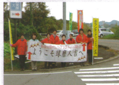
←赤いジャンパーであておかえ!

山江村ボランティア連絡協議会(以下、「山江村ボラ連」とする)も、他の市町村ボラ連や社協と一緒に、県内外から来られたボランティアの方々を出迎え、相互交流を図りました。