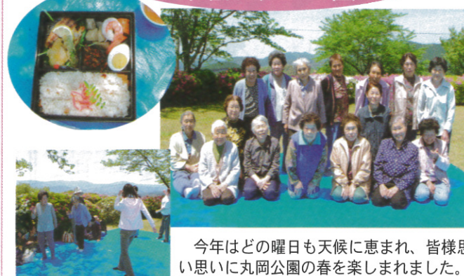
今年はこの日も天候に恵まれ、皆様思い思いに丸岡公園の春を楽しまれました。