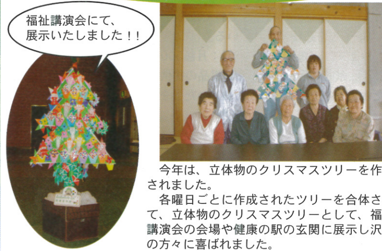
福祉講演会にて、展示いたしました!!