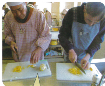
野菜たっぷりヘルシー丼でした!