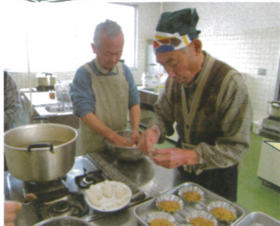
自分たちで作った懐かしい郷土の味に自然と会話も弾みました。