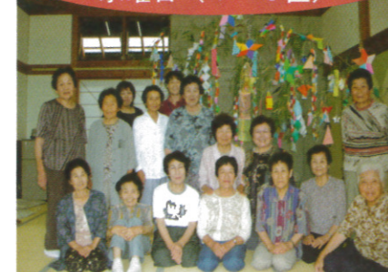
各曜日ごとに作成された七夕飾りは、毎年、温泉センターに飾られ、温泉の利用客の方々にも喜ばれています。