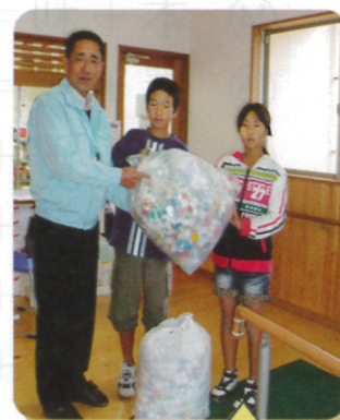
山田小学校、万江小学校にて集められたペットボトルのフタもお寄せいただきました。